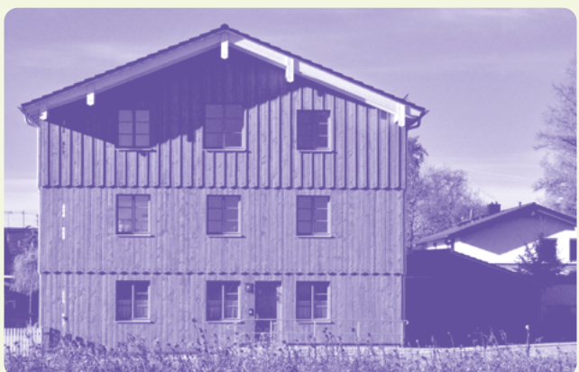
Bezahlbarer Wohnraum, Iffeldorf

Architektur: Sunder-Plassmann Architekten → Café Kumpel, Zibetholzweg 2, 82377 Penzberg → Weitere Informationen: erhalten Sie im Vorfeld bei unserer Geschäftsstelle oder auf der Website www.wessobrunner-kreis.de → Anmeldung: info@wessobrunner-kreis.de