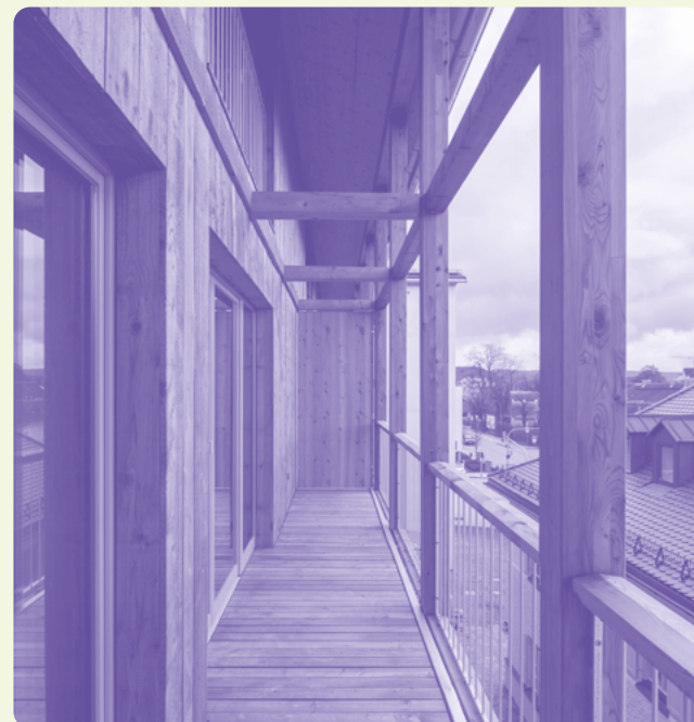
Altes Krankenhaus, Wolfratshausen

Das robuste Haus: Federico Farinatti Bezahlbarer Wohnraum Iffeldorf: Oliver Jaist Genossenschaftlicher Wohnungsbau Freiham: The Pl. Odessa Co / Lanz & Schels Altes Krankenhaus Wolfratshausen: Sebastian Schels