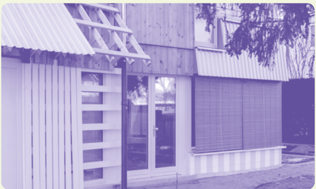
Das robuste Haus