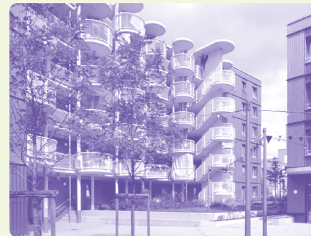
Genossenschaftlicher Wohnungsbau, Freiham